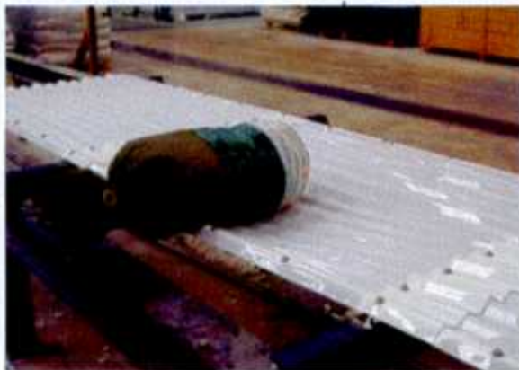
Vue après chute du sac de 50 kg