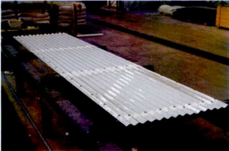
Vue de la maquette et du banc d'essai de choc